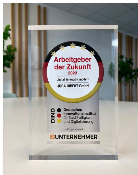
Auszeichnung „Arbeitgeber der Zukunft“